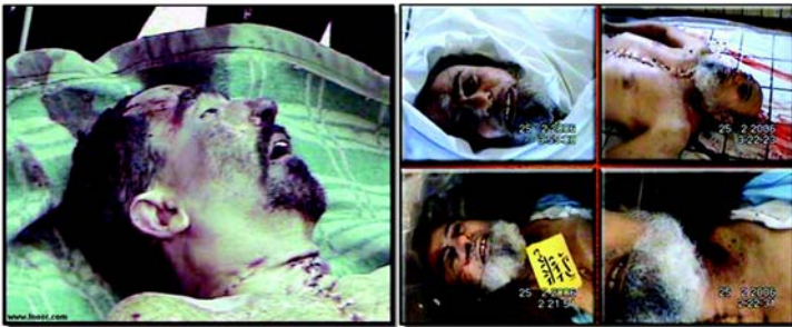
صورة أحد علماء السنة بالعراق بعد ان مثل بجثته رحمه الله